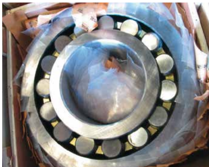
Beide Fotos zeigen Fälschungen. Falsche Verpackung und fehlende Kennzeichnung der Wälzlager.