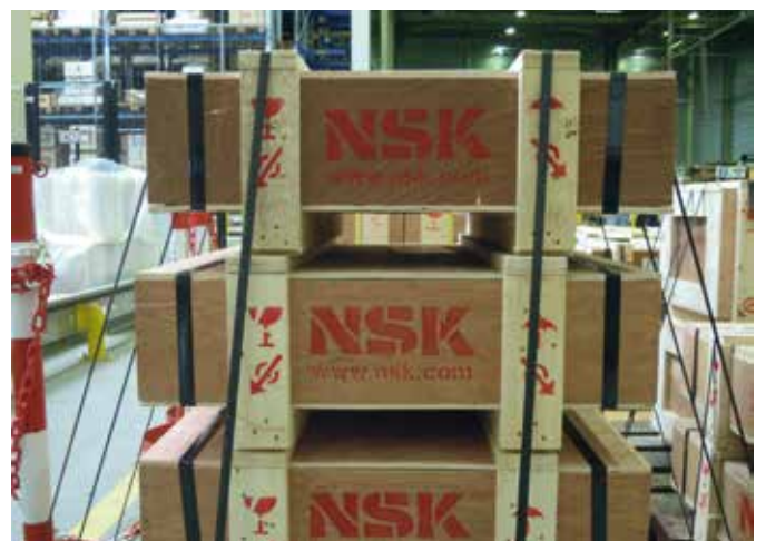
Echtes NSK Logo auf Holzkisten

Sollten Sie in Bezug auf ein von Ihnen gekauftes NSK Produkt Zweifel haben, wenden Sie sich bitte an Ihren Vertriebspartner oder direkt an NSK Europe: info-uk@nsk.com . Wir werden Ihre Anfrage dann an den für Sie zuständigen Vertriebsmitarbeiter weiterleiten.